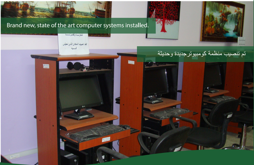
Brand new, state of the art computer systems installed.