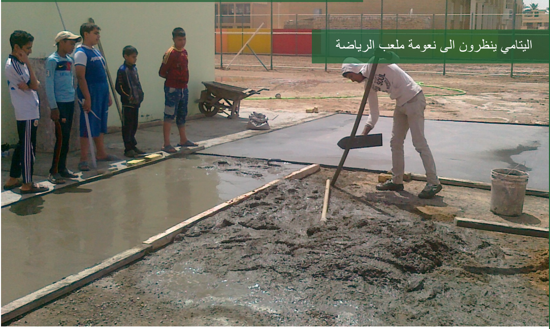
اليتامي ينظرون الى نعومة ملعب الرياضة