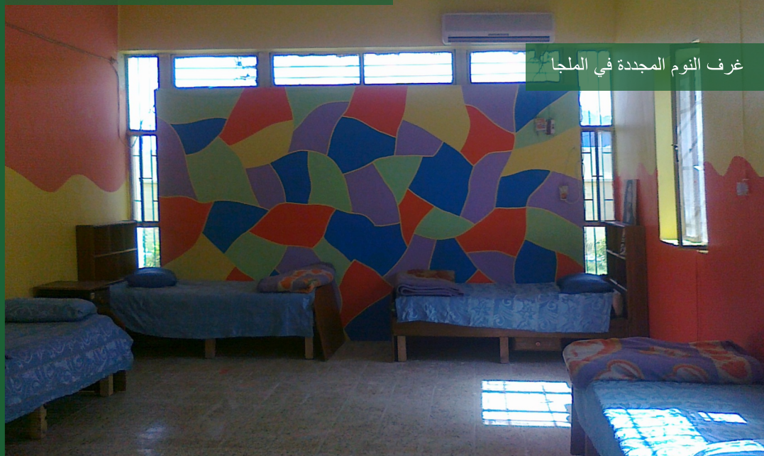
غرف النوم المجددة في الملجأ