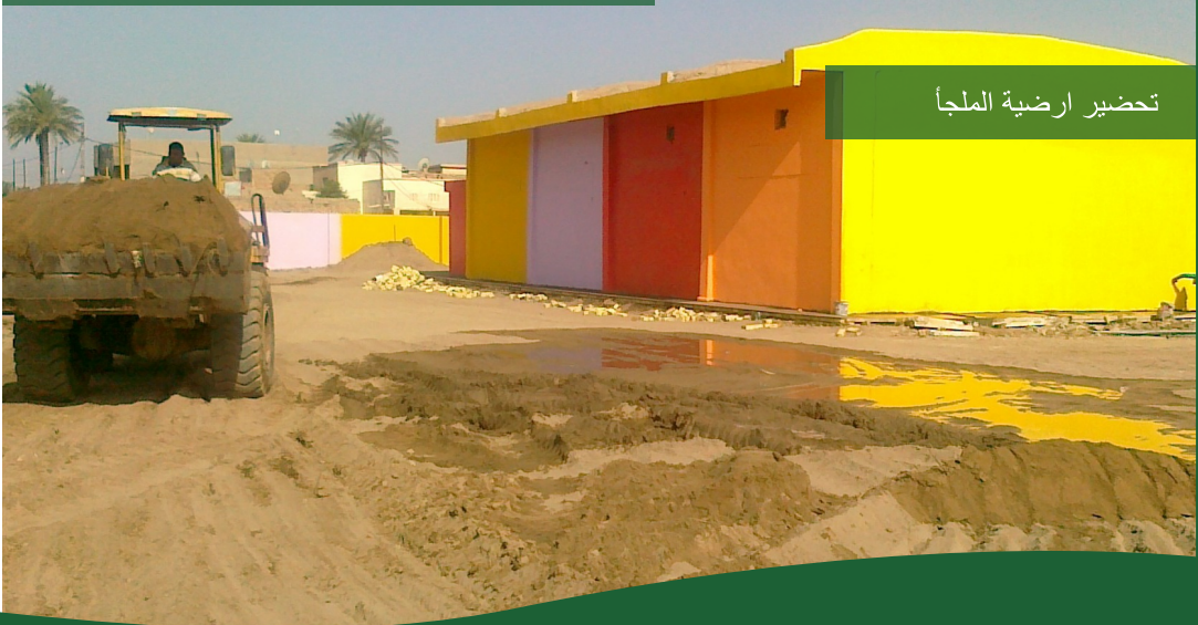
تحضير ارضية الملجأ